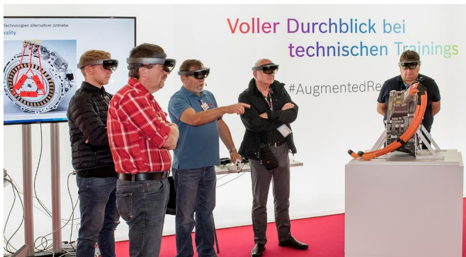
Augmented Reality Workshop auf der Automechanika Frankfurt

Praxisorientierte Workshops sind seit Jahren fester Bestandteil der Automechanika. Die zunehmende Digitalisierung und neue technologische Entwicklungen stellen viele Werkstätten vor große Herausforderungen. Um Schritt halten zu können, sind regelmäßige Weiterbildungen notwendig. Die Automechanika Frankfurt bietet dafür in Kooperation mit namhaften Partnern praxisorientierte Workshops in Deutsch und Englisch an, die Kfz- und Nfz-Profis zeigen, worauf es ankommt.